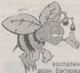
воспалении десен. Бактерицидные свойства меда сохраняют в разведенном состоянии вплоть до 1:100, а бактериостатическое - до 1:1000. Очень прост рецепт для лечения ангины: меда - две части, сока алоэ - 1 часть, водки - 3 части. Смешать. Использовать в виде компрессов.

Мед применяется при лечении ринитов и гайморитов, при заболевании полости рта и горла, при